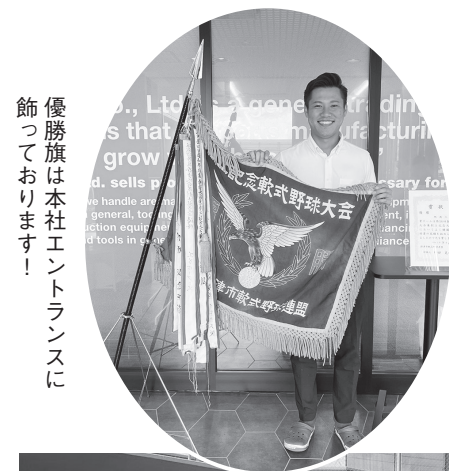
優勝旗は本社エントランスに飾っております!

2023年3月頃から本格的に野球部が活動し、7月に市内大会(大阪府摂津市)の決勝戦が行われました。 決勝戦の結果は4-3で勝利。なんと春季大会で、初出場・初優勝する事が出来ました! 優勝の証にいただいた優勝旗は、本社エントランスに飾らせていただいております。 優勝後、摂津市代表として大阪府の夏季大会に出場いたしました。 今後の野球活動については、またザ・ユー