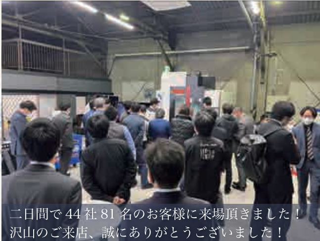
二日間で44社81名のお客様に来場頂きました! 沢山のご来店、誠にありがとうございました!

イスカルジャパン(株)、(株)MSTコーポレーション、オーエスジー(株) (株)Cominix、ジェービーエムエンジニアリング(株)、(株)ジーネット (株)ノイタービラック、三菱マテリアル(株)、ヤマザキマザック(株) フルタージャパン(株)、ブラザースイスループジャパン(株) TOTIME JAPAN