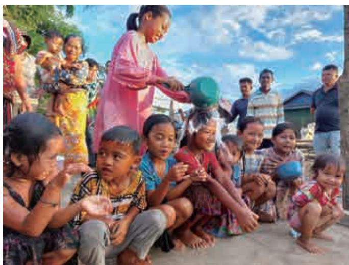
子どもたちが水浴びを喜んでいる様子^^