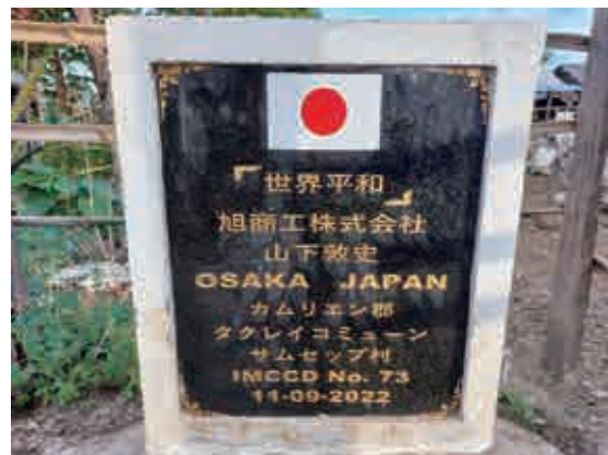
2022-11-9 カンボジア王国 バタンバン州カムリエン郡へ井戸を寄贈

寄贈した井戸で、カンボジアの方々の生活がより一層豊かになることを心から願っております。