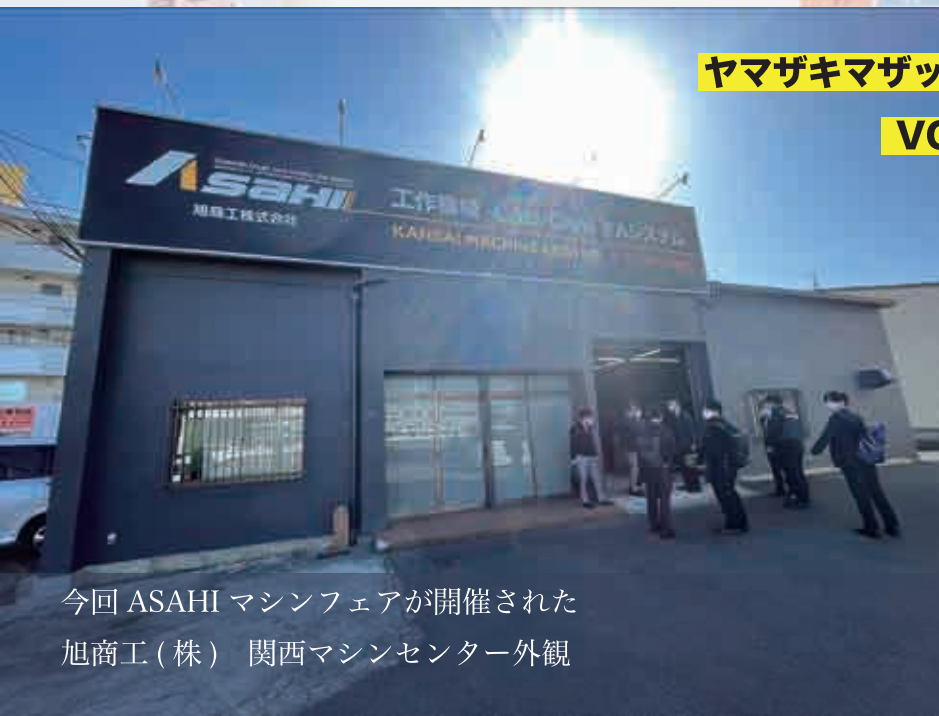
今回 ASAHI マシンフェアが開催された 旭商工(株) 関西マシンセンター外観