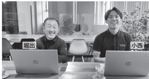
設備自動化専門職