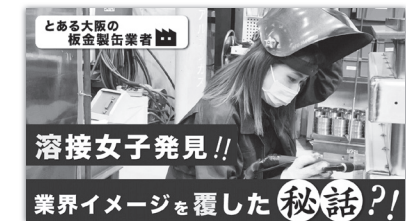
YouTube配信 富士溶工様の工場への潜入#52

弊社ではSNSを活用しさまざまな内容を配信しております。Twitterではプレゼント企画を実施や、YouTubeではものづくり企業様取材し、「ものづくりの魅力」をお届けしております！ぜひチェックしてみてください。今後ともMONOFULではSNSを通してものづくりの魅力をお伝えしていきます。「自社の製品の良さを色んな人知ってほしい!」「PRしたい」などのご要望がございましたらぜひ気軽にお問合せください！