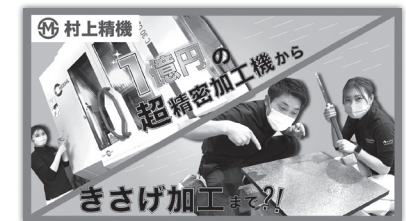
YouTube配信 村上精機様きさげ技術について#54